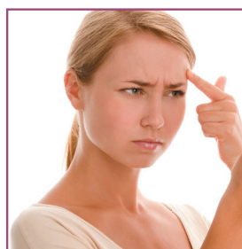
ACNÉ LOIN AVEC ELLE