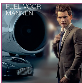
ANTI - ÂGE HOMMES