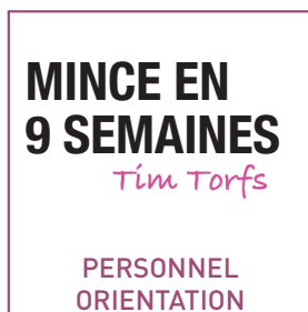
OU DE SUIVI